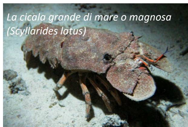
La cicala grande di mare o magnosa (Scyllarides latus)