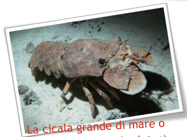
La cicala grande di mare o magnosa (Scyllarides latus)